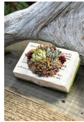
プランターサイズ W113xL80xH57mm

ぷっくりと可愛い多肉植物を使って、まるで本から飛び出したような寄せ植えを作ってみませんか? 初心者さま大歓迎です! お手入れ方法やもっと多肉植物を楽しむコツもお伝えします。植物に触れながら楽しいひとときを一緒に過ごしましょう。